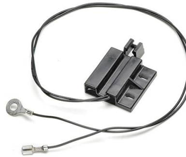
定制切断开关和磁铁组件