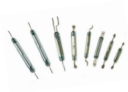
干簧开关SMD 安装, 带扁形或圆形引脚