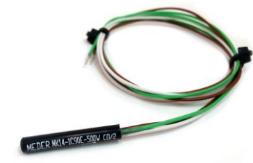
圆柱型接近传感器